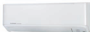
SRK25, 35, 45 -ZMP