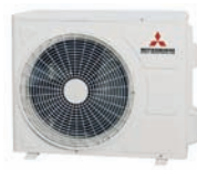
SRC25, 35, 45-ZMP